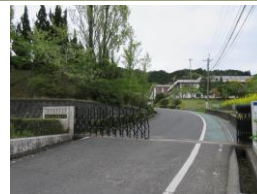
三雲東小学校歩14分