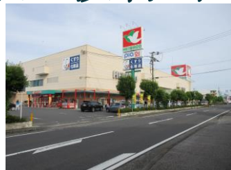
平和堂石部店歩7分