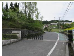
三雲東小学校歩14分