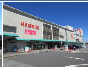
平和堂甲西中央店歩4分