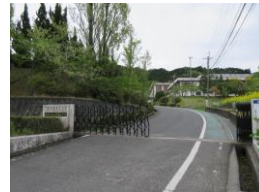
三雲東小学校歩14分